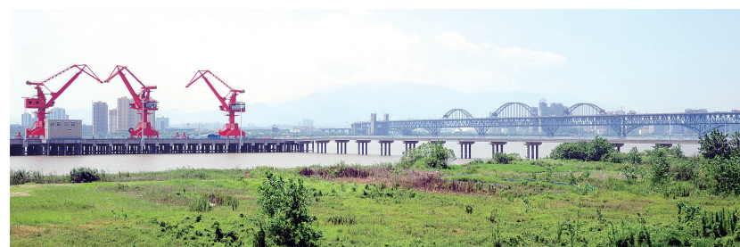
小池5000吨级综合码头与九江长江公路大桥。

具特色的印记。2000年3月,小池镇开通了全国首条跨省公交线路——自小池镇乘17路公交车可直接抵达江西省九江市。隔江相望却分省而治的小池镇和九江市被串联了起来。这里也有全国少见的超低价火车票——6026次列车自九江至小池口的火车票,票面价格仅为1元。如果自驾,自小池镇出发,50分钟到南昌,2小时抵武汉,到达合肥也仅需要3小时。